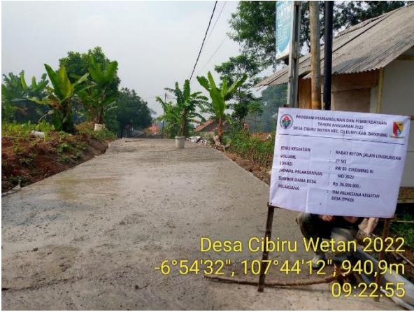
Desa Cibiru Wetan 2022 -6°54'32", 107°44'12", 940,9m 09:22:55