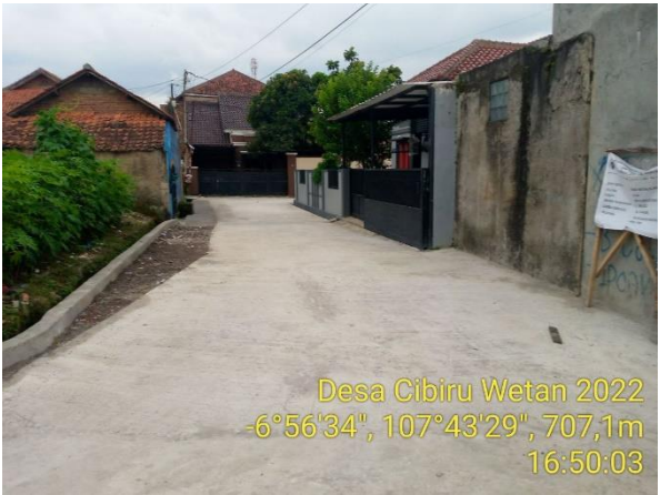
Desa Cibiru Wetan 2022 -6°56'34", 107°43'29", 707,1m 16:50:03