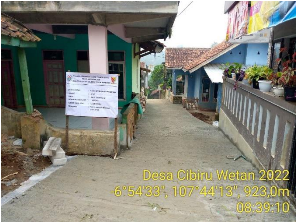
Desa Cibiru Wetan 2022 -6°54'33", 107°44'13", 923,0m 08:39:10