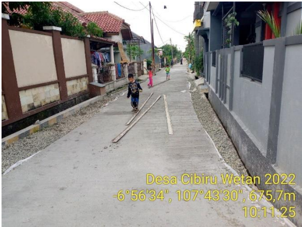
Desa Cibiru Wetan 2022 -6°56'34", 107°43'30", 675,7m 10:11:25