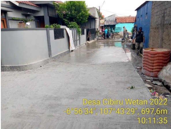
Desa Cibiru Wetan 2022 -6°56'34", 107°43'29", 697,6m 10:11:35