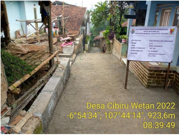
Desa Cibiru Wetan 2022 -6°54'34", 107°44'14", 923,6m 08:39:49