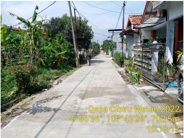
Desa Cibiru Wetan 2022 -6°56'36", 107°43'29", 702,5m 10:13:12