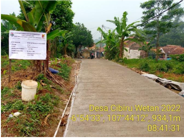
Desa Cibiru Wetan 2022 -6°54'33", 107°44'12", 934,1m 08:41:31